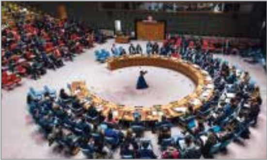
گروه سیاسی // نماینده دائم ایران در سازمان ملل با ارسال نامه‌ای به دبیرکل و رئیس شورای امنیت، نسبت به تهدید علنی رهبر انقلاب از سوی وزیر جنگ رژیم صهیونیستی هشدار داد.ایروانی در ایسن نامه، اظهارات پسر ائیل کاتس مبنی بر اینکه آیت‌الله

به تهدید علنی رهبر انقلاب از سوی وزیر جنگ رژیم صهیونیستی هشدار داد.ایروانی در ایسن نامه، اظهارات پسر ائیل کاتس مبنی بر اینکه آیت‌الله