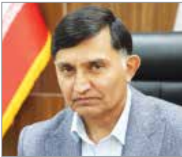
گروه سلامت // معاون بهداشتی دانشگاه علوم پزشکی هرمزگان از انجام ۴ هزار و ۶۷ مورد بازرسی بهداشتی از مساجد، حسینیه‌ها، تکایا، موبک‌ها، ایستگاه‌های صلواتی و مراکز

مدیر گروه مهندسی بهداشت محیط دانشگاه علوم پزشکی البرز در پایان، مسئولیت نهادهای متولی را در این زمینه بسیار سنگین برشمرد و خاطر نشان کرد: اتخاذ سازوکارهای مناسب برای جمع‌آوری بهداشتی پسماند از درب منازل، بازیافت علمی زیاله‌های خشک (با هدف حذف فعالیت غیربهداشتی دوره‌گردها)، تولید کمپوست از پسماندهای تر، استحصال انرژی از پسماند، دهن بهداشتی و در نهایت بی‌خطرسازی اصولی پسماندهای عفونی، از جمله راهکارهایی است که سازمان‌های مسئول باید برای حفظ بهداشت عمومی جامعه با جدیت پیگیری کنند.