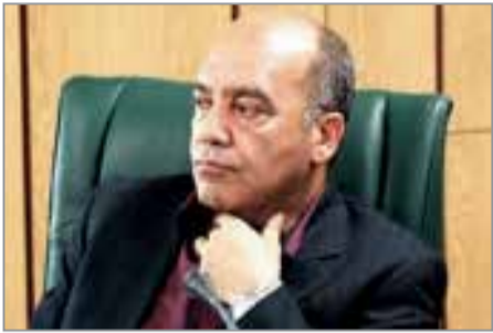
گروه سلامت // رییس مرکز بودجه و پایش عملکرد وزارت بهداشت از آغاز پرداخت حقوق اعضای هیات علمی دانشگاه‌های علوم پزشکی بر اساس احکام مصوب

و قانونی خبر داد و گفت: این پرداخت‌ها با پیگیری‌های وزیر بهداشت، معاون توسعه مدیریت و منابع وزارت بهداشت و هماهنگی‌های انجام‌شده با سازمان برنامه و بودجه کشور، فرآیند پرداخت حقوق اعضای هیات علمی بر اساس احکام مصوب و قانونی آغاز شده است. وی افزود: پرداخت‌ها آغاز شده و مطابق برنامه، به‌صورت تدریجی به حساب اعضای هیات علمی دانشگاه‌های علوم پزشکی سراسر کشور واریز خواهد شد تا حقوق این عزیزان مطابق احکام قانونی پرداخت