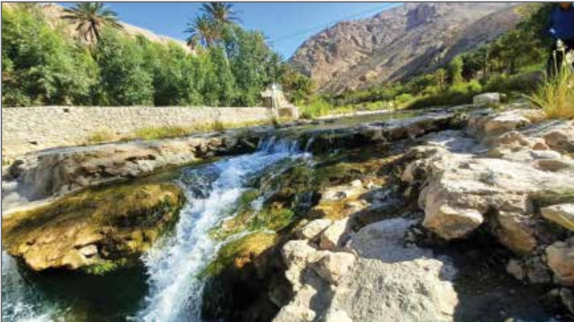
طبیعت روستای زیبای سیخوران (سیاهو)