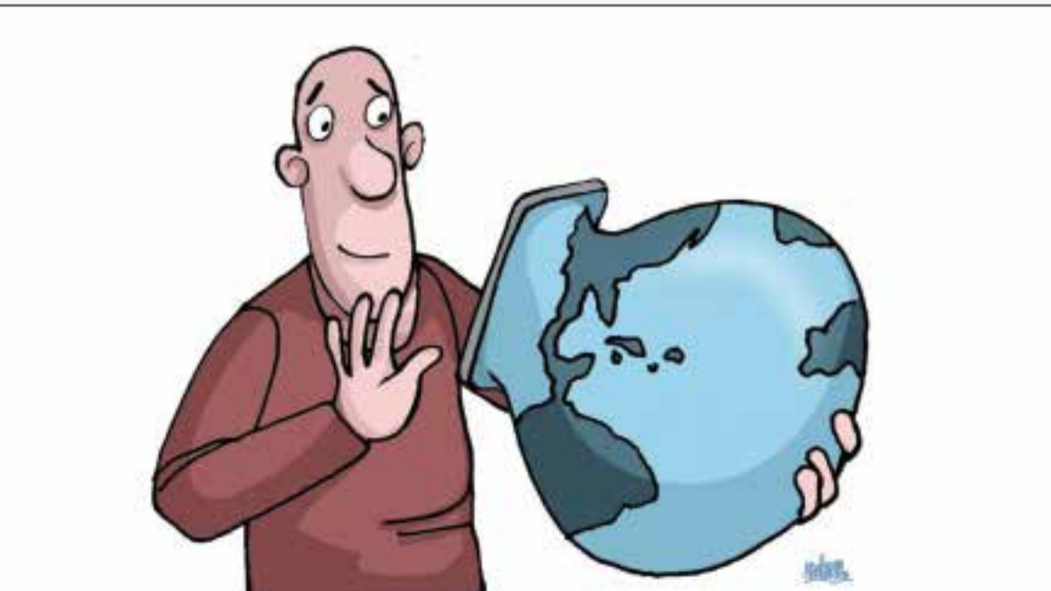
ارتباطات با جهان