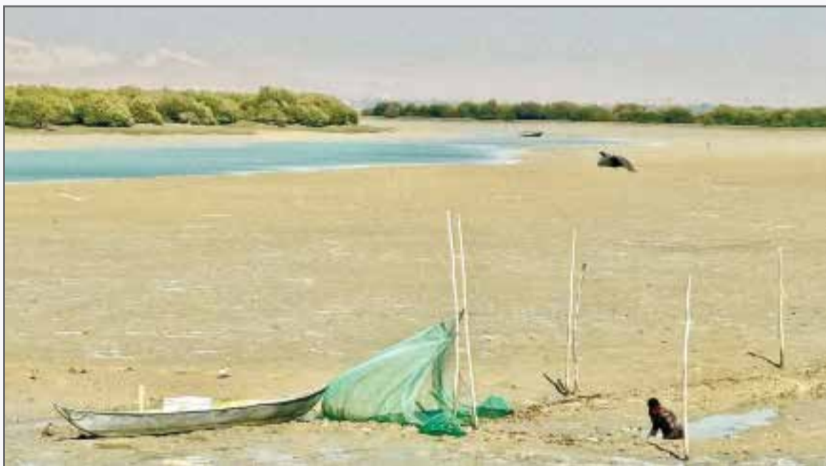
روستای گردشگری سهیلی