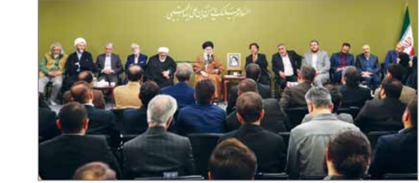
چهره‌های نمایندگان هیات مدیره در جلسه هیات مدیره

اجتماعی شوق‌آفرین در زمان کنونی را ظرفیتی شوق‌آفرین برای استفاده در اشعار خواندند و گفتند: در این جلسه از شهیدان سلیمانی، رئیس، نصرالله و سنوار اشعاری خوانده شد که این مفاهیم زنده کننده می‌تواند به وسیله شعر در اذهان مردم زنده بماند، همچنانکه بیان مفاهیم توحیدی و معرفتی و حکمت‌آمیز نیز در اشعار بسیار با ارزش و دارای مضامین خود است.حضرت آیت‌الله خامنه‌ای سنت آغاز دفاتر شعری با توحید و ستایش پروردگار را سنتی ارزنده و قابل الگوگیری برای شاعران کنونی دانستند.ایشان همچنین با اشاره به برخی برنامه‌های