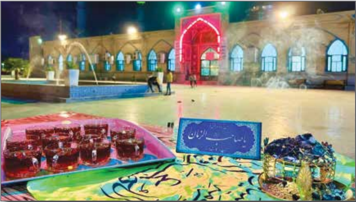
گلزار شهدای بندرعباس