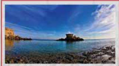
◀️ جزایر ناز