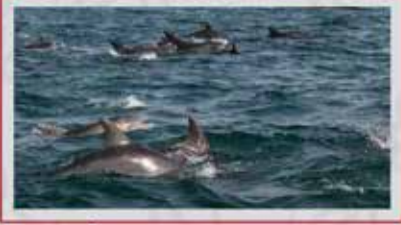
◀️ دلفین‌های جزیره هنگام