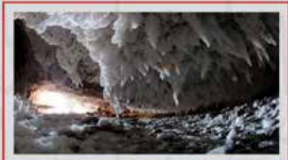
◀️ غار نمکدان