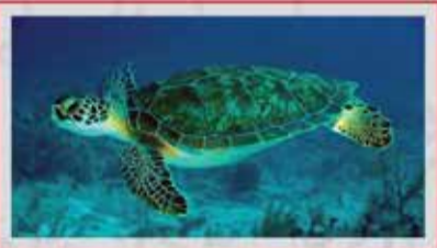
◀️ لاک‌پشت‌های پوزه عقابی