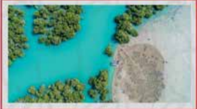
◀️ جنگل‌های حرا