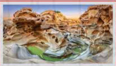
◀️ تنگه چاهکوه