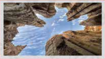
◀️ دره ستارگان