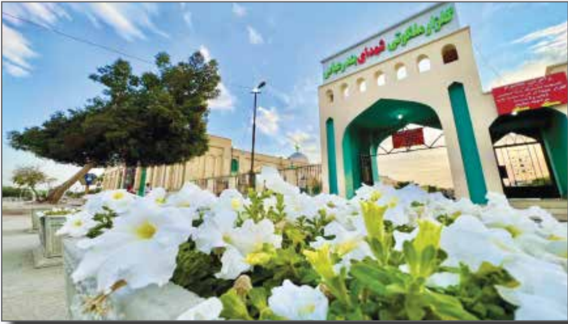
کلیز از شهدای بندرعباس