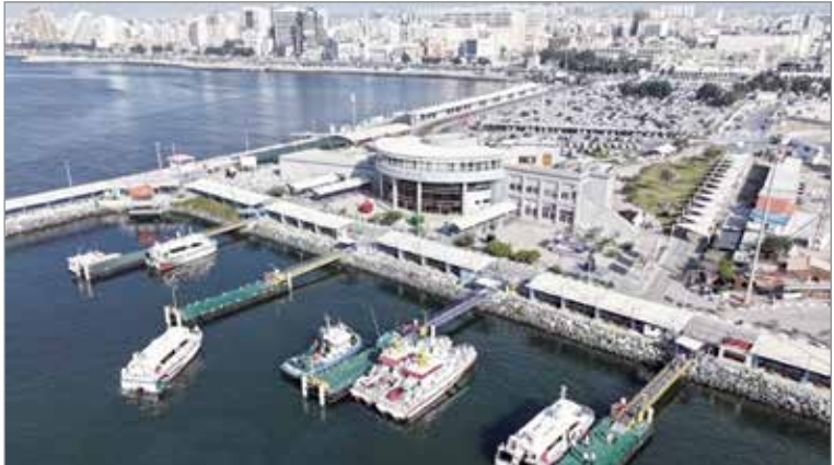
گروه خبر // در طرح سفرهای دریایی نوروزی ۳۵ شناور همیار ناجی در آبراه‌های هرمزگان مستقر می‌شود. معاون دریایی اداره کل بنادر و دریانوردی

به گزارش خبرنگار صدا و سیما مرکز خلیج فارس؛ معاون دریایی اداره کل بنادر و دریانوردی هرمزگان افزود: طرح تسهیل سفرهای نوروزی از ۲۳ اسفند آغاز می‌شود و تا ۱۵ فروردین سال آینده ادامه می‌یابد.