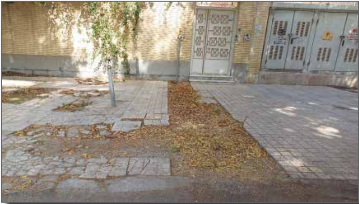
حفاری های گازکشی کوچه های کوی فرهنگیان بندرعباس هنوز ترمیم نشده اند