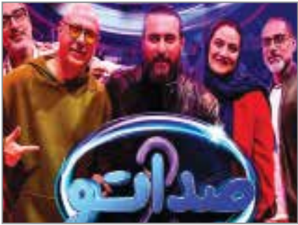
گروه فرهنگ و هنر // فصل سوم برنامه «صداتو»

به گروه فرهنگ و هنر // فصل سوم برنامه «صداتو» با اجرای سیامک انصاری از ۱۳ اسفندماه در شبکه نمایش خانگی منتشر می‌شود.