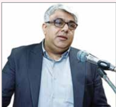
مجید زارعه / سرپرست اداره کل استاندارد هرمزگان