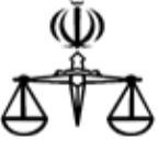
تومنار کورسانبیت‌رئیس‌جمهورکوزم جرزبیت‌ملک‌شم

آکهی موضوع ماده ۱۱۳قانون وماده ۱۱۳این نامه قانون تعیین تکلیف وضعیت ثبتی اراضی وساختمانهای فاقد سند رسمی