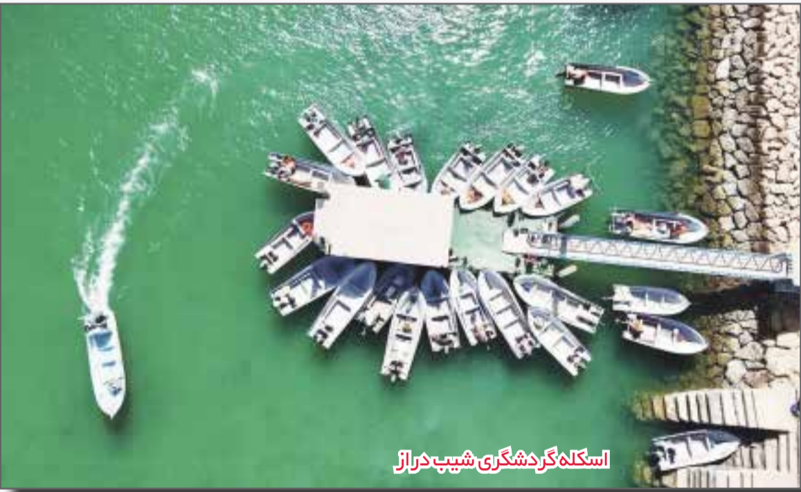
اسکله گردشگری شیب دراز