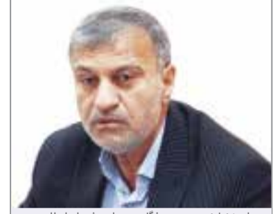
مرادی/نماینده مردم هرمزگان در مجلس شورای اسلامی