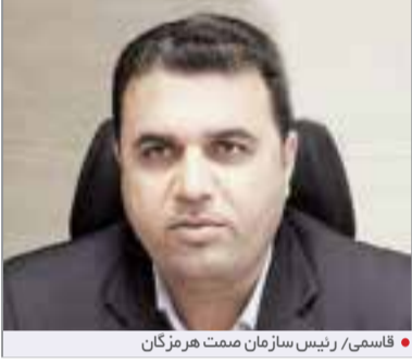
قاسمی / رئیس سازمان صمت هرمزگان

کمک صنعت برق آمده‌اند. رئیس سازمان صمت هرمزگان خاطر نشان کرد: «ما در این مجموعه بنا داریم تولید برق واحدهای صنعتی را به بیش از ۵۰۰ مگاوات برسانیم و پروژه‌های که شروع شده، بخشی از این برنامه است. البته باید این ظرفیت را به بیش از هزار مگاوات برسانیم تا صنایع بتوانند انرژی مورد نیاز خود را تأمین کنند و واحدهای تولیدی دیگری که در اختیار وزارت نیرو هستند نیز بتوانند خدمات لازم را برای مردم ارائه دهند.»