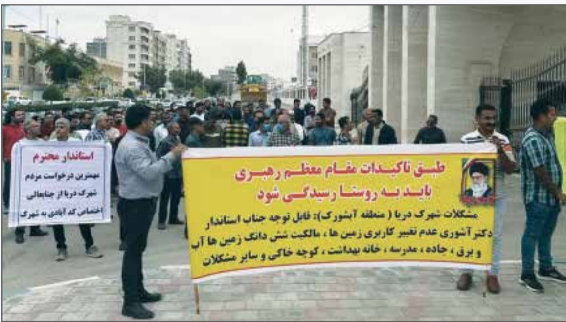
تجمع دیروز ساکنان شهرک دریا مقابل استانداری هرمزگان جهت رسیدگی به مشکلات شان