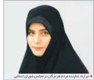
زحراه/نماینده مردم هرمزگان در مجلس شورای اسلامی

استاندار هرمزگان در مراسم کلنگ‌زنی پروژه ساخت واحد بخار نیروگاه سیکل ترکیبی آلومینیوم مهدی، بر اهمیت این پروژه در توسعه همه‌جانبه استان تأکید کرد. وی با اشاره به سرمایه‌گذاری ۱۱۰ میلیون یورویی گروه مینا و مشارکت سایر نگاهداری‌های اقتصادی در این پروژه، اظهار داشت که ساخت این واحد طی ۳۲ ماه انجام خواهد شد. بهره‌برداری از آن علاوه بر کمک به رفع ناترازی برق در سطح ملی، نقش بسزایی در تأمین برق پایدار مجتمع آلومینیوم مهدی دارد و تضمین‌کننده پایداری تولید این مجموعه صنعتی بزرگ خواهد بود.