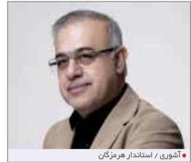
شوری / استاندار هرمزگان