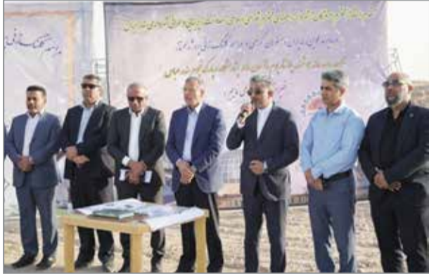
مراسم کلنگ زنی رصدخانه مدرن شهر بندرعباس