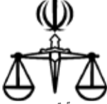
توهفتاد و سه روز ثبت اسناد و املاک تهران

و ماده ۱۳ آئین نامه قانون تعیین تکلیف وضعیت ثبتی و اراضی و ساختمانهای فاقد سند رسمی