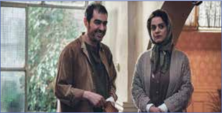
نگران را به خوبی به تصویر یکشد.به گزارش قدس