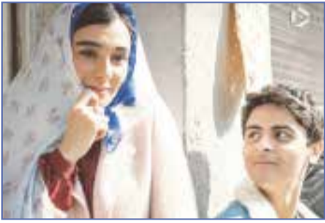
که زمانی مانند هر خانواده متوسطی یک زندگی

گروه فرهنگ و هنر // اولین اثر تحسین‌شده جشنواره فجر در روزهای ابتدایی، فیلم متفاوت «بچه مردم» است که از منظر اجرایی چشمگیری ظاهر می‌شود و از نظر محتوا نیز وضعیت خوبی دارد.