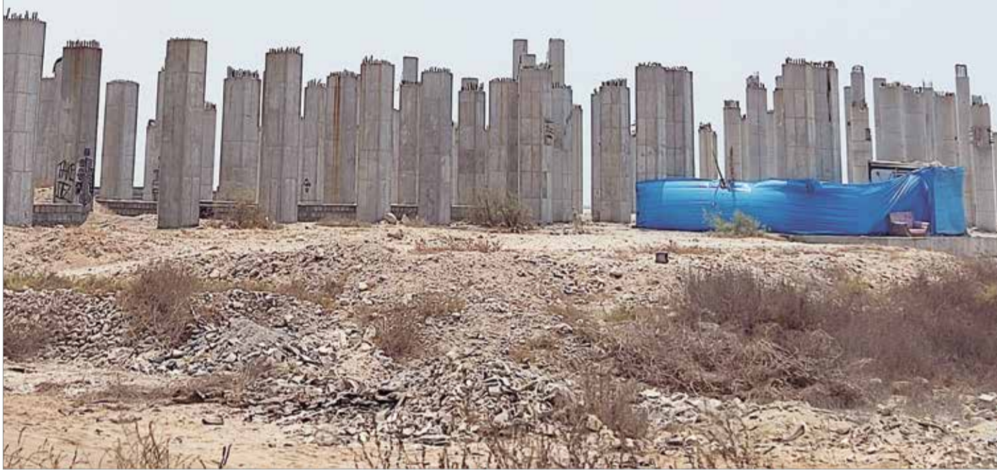
عکس: امین زاوی