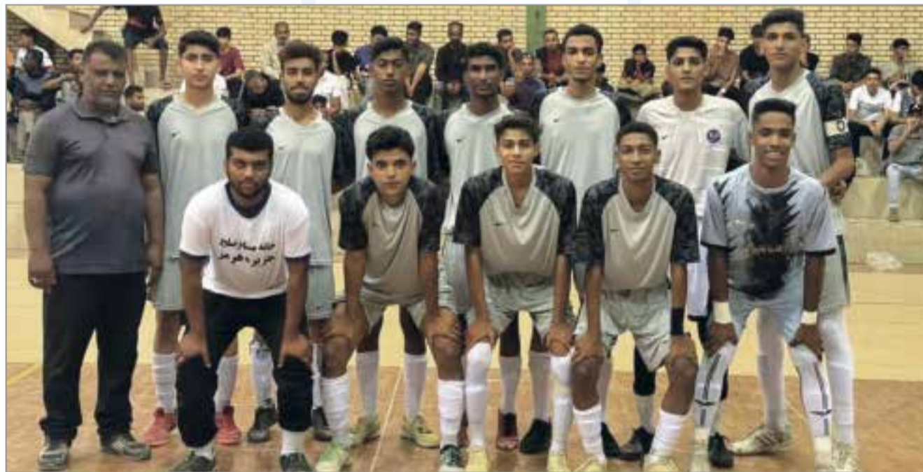
چهار تیم دلاوران، ساحل شهرداری سیریک، پالاهنگ و هدف هرمز حضور دارند که در دیدارهای انجام شده تاکنون این نتایج به دست آمده است. بازی روز نخست