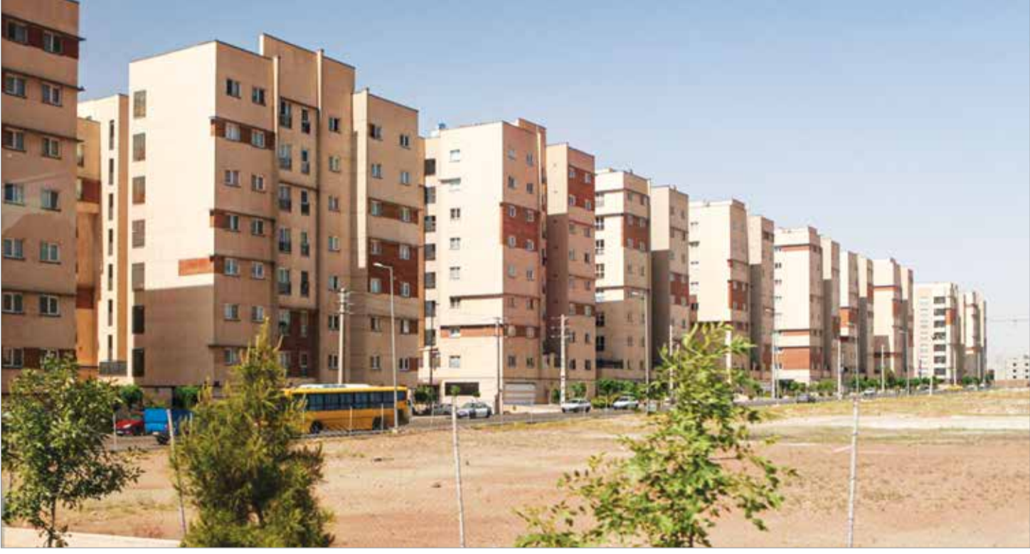
عکس از صفحه ۳

افزایش نارضایتی ها از قطعی‌های روزانه برق؛