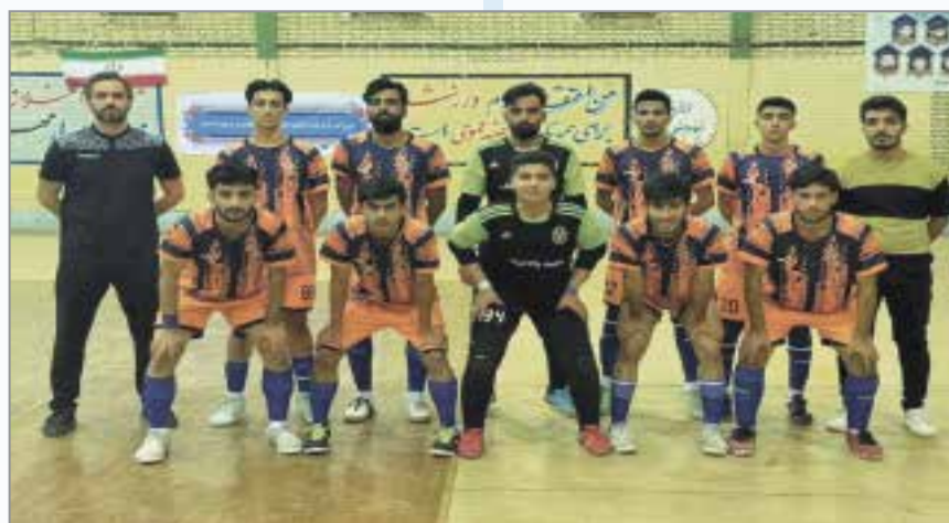
گروه ورزشی // مسابقات فوتسال قهرمانی لیگ برتر زیر ۲۱ سال استان هرمزگان با حضور هفت تیم در دو گروه به میزبانی بندرعباس و جزیره هرمز آغاز شد. به گزارش خبرنگار دریا؛ در گروه دوم در جزیره هرمز

دربازی روزنخست دو تیم دلاوران هرمزگان و شهید پالاهنگ به میدان رفتند. در این دیدار نزدیک و پر هیجان که پنج گل بین دو تیم ردوبدل شد. تیم پالاهنگ موفق شد حریف خود را ۳ بر دو شکست دهد.