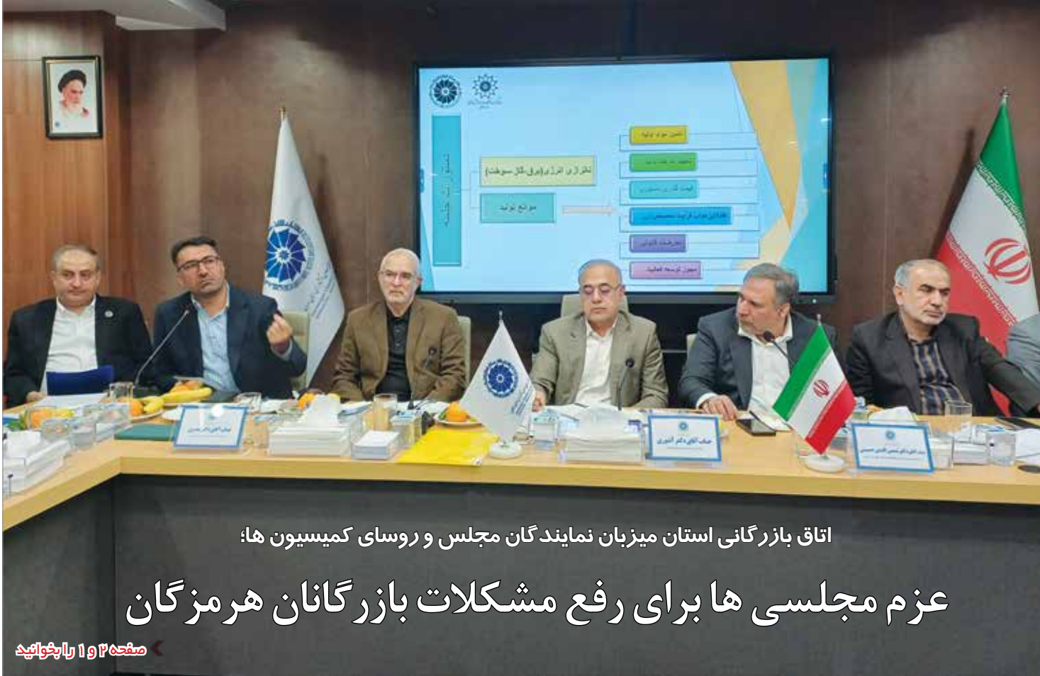
اتاق بازرگانی استان میزبان نمایندگان مجلس و روسای کمیسیون ها؛