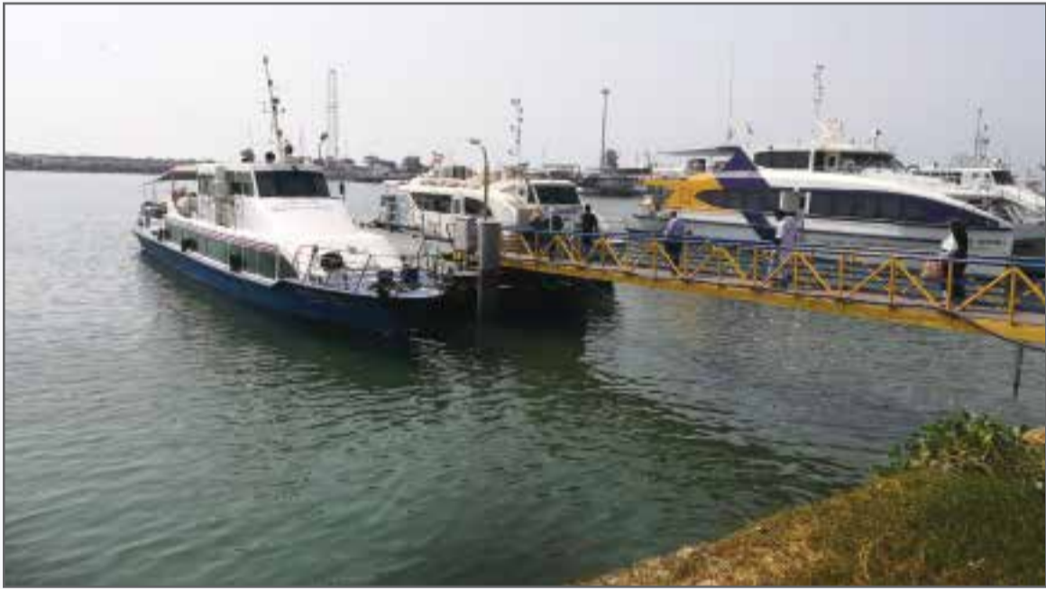
اسکله شهید حقانی