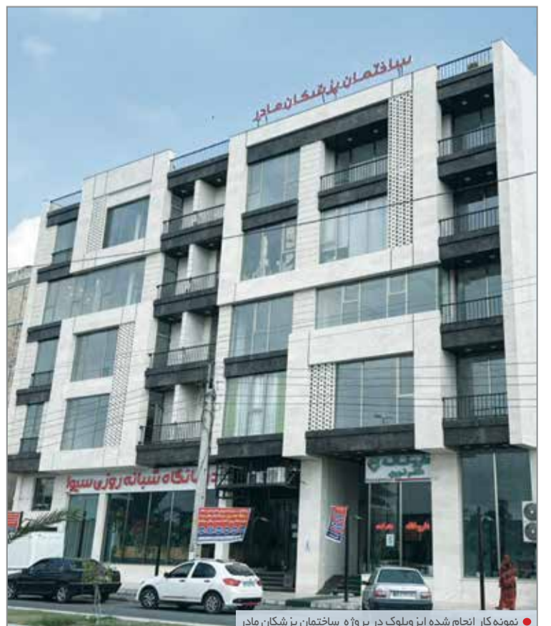
نمونه کار انجام شده ایزوبلوک در پروژه ساختمان پزشکان مادر