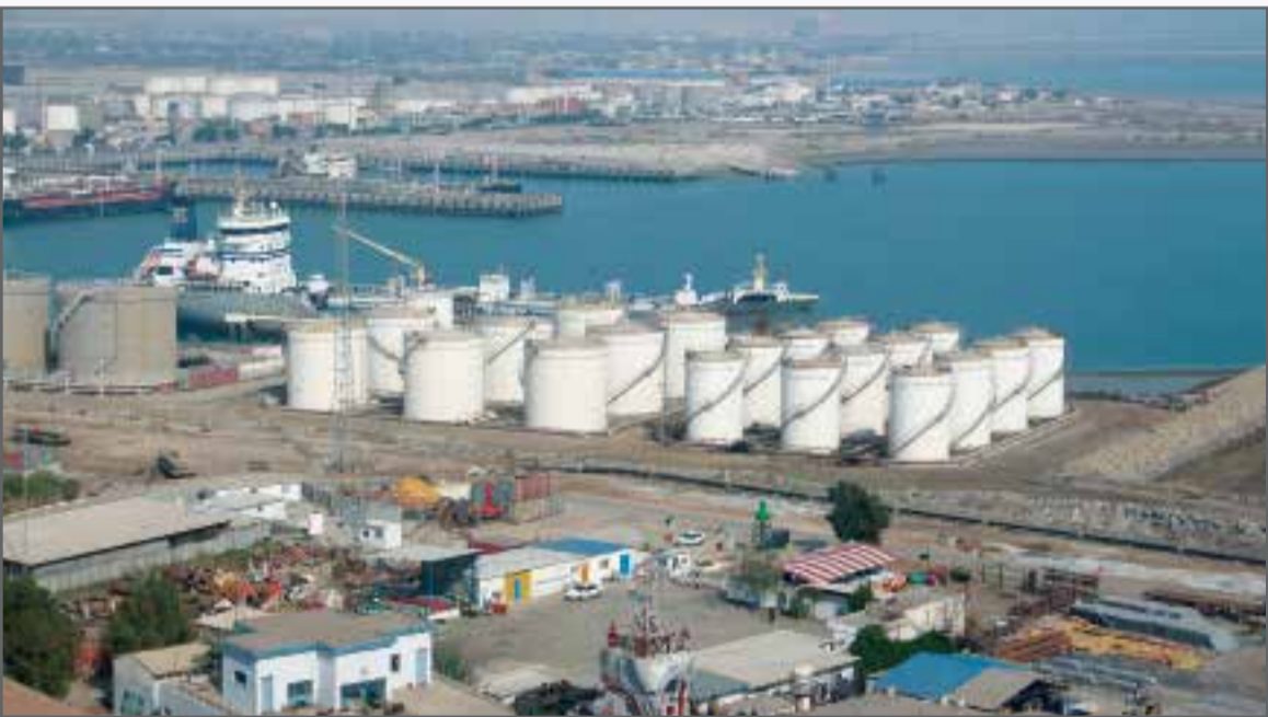
بزرگترین بندر تجاری ایران - بندر شهید رجایی