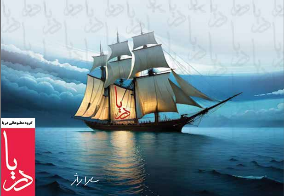
گروه مطبوعاتی دریا