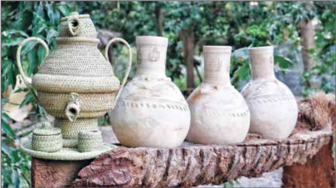
صنایع دستی هرمزگان