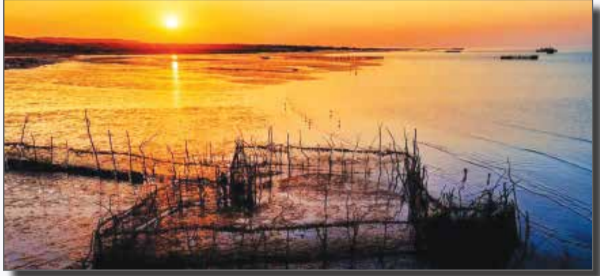
مشتا زیر نور طلایی غروب های چشم نواز قشم