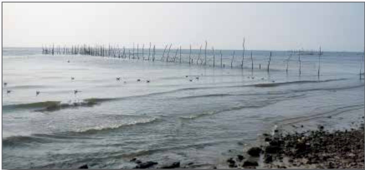
صید مشتاد در بندرعباس