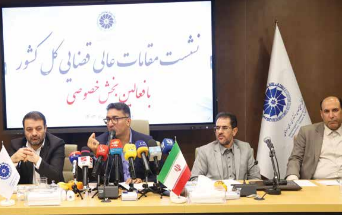
رئیس کل دادگستری هرمزگان تأکید کرد