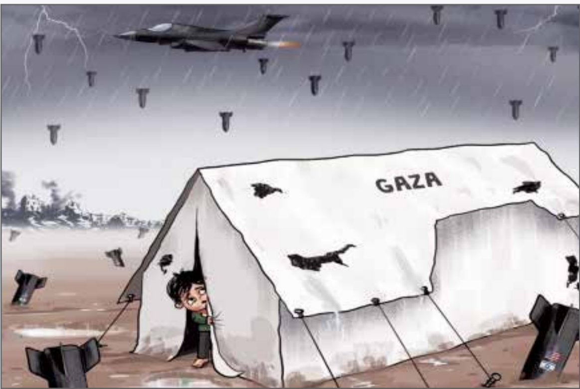
آب و هوا در غزه