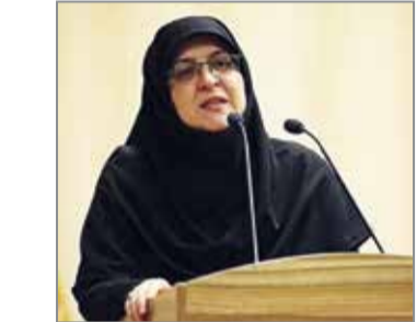
مدیرعامل سازمان بنادر و دریانوردی در نشست خبری

مدیرعامل سازمان بنادر و دریانوردی با اشاره به اینکه در حال حاضر بیش از ۱۵۰ همت پروژه سرمایه‌گذاری در بنادر کشور، تعریف شده است، بیان کرد: از این میزان حداقل ۶۰ همت توسط بخش خصوصی تأمین می‌شود؛ گفتنی است سازمان بنادر و دریانوردی در حوزه زیربناها از جمله انبار لایروبی، ساخت موج شکن، اسکله … که تأمین مالی بالایی دارند و بعضاً سرمایه‌گذاری در توان بخش خصوصی نیست، فعالیت می‌کند و سرمایه‌گذاران بخش خصوصی نیز در حوزه روبناها از جمله ساخت انبار، سیلو، محوطه و … فعالیت دارند.بر اساس گزارش سازمان بنادر و دریانوردی، صفایی در پایان با تأکید بر اینکه دستور رئیس جمهور اصلاح وروها است، گفت: دستور رئیس جمهور در خصوص توسعه دریامحور با اولویت سواحل مکران بسیار امیدوارکننده و نویدبخش بود و به طور حتم تاوام جلسات با حضور وی در منطقه موجب خواهد شد فعالیت‌ها به بهترین شکل پیش برود./ قدس آنلاین