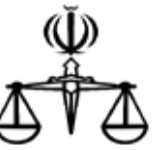
تومانیف دوگسری هموری آسمای ایران

خیابان آیت الله غفاری – بیمارستان شریعتی– پشت شرکت آب و فاضلاب استان ضلع غربی بهزیستی بندرعباس تلفن:۰۹۱۷۷۹۷۵۳۰۲