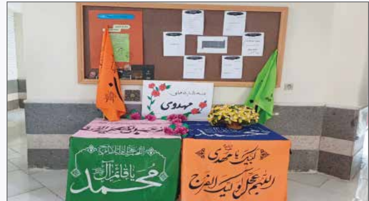
سه شنبه های مهدوی در مدرسه فرز انگان ۲ بندرعباس