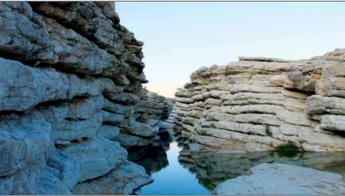
روستای همگ سیاهو