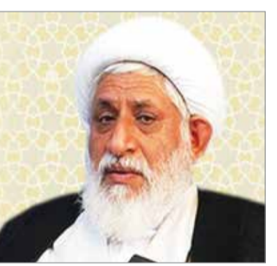
● آیت الله ابراهیمی - نماینده مردم هرمزگان در خیرگان رهبری

وی به موضوع ایجاد نیروگاه‌های تجدیدپذیر خورشیدی اشاره کرد و گفت: اقدامات اجرایی آن در هفته‌های گذشته انجام گرفته است تا ۸۰ مگاوات برق را از این طریق به دست آوریم و این مسئله کمک شایانی در مواقع محدودیت و اضطراری به مجموعه خواهد کرد. مدیرعامل شرکت فولاد کاوه جنوب کیش به احداث نیروگاه اختصاصی شرکت پرداخت و تصریح کرد: اراضی آن در سنوات گذشته واگذار شده و در دو ماه گذشته مجوز زیست محیطی آن را دریافت کردیم و در ماه‌های آتی فرآیند انتخاب پیمانکار و عملیات اجرایی نیروگاه را آغاز خواهیم کرد. حاتم‌ی در بخش دیگری از سخنان خود به ایفای نقش مسئولیت‌های اجتماعی شرکت فولاد کاوه اشاره کرد و عنوان داشت: این مجموعه تولیدی علاوه بر وظیفه اصلی که بر عهده دارد و با توجه بر اینکه سهم سود این شرکت به محرومیت زدایی در کشور تخصیص و هزینه می‌شود اقداماتی را در سنوات گذشته و ماه‌های قبل انجام داده‌ایم، وی افزود: ما مستمراً در تامین اکسیژن بیمارستان دولتی نقش قابل توجهی داریم و این کار از پنج سال قبل در جریان است. مدیرعامل شرکت فولاد کاوه جنوب کیش از ایجاد یک باشگاه فرهنگی ورزشی خبر داد و گفت: در حال برنامه ریزی مقدمات این امر هستیم تا بتوانیم علاوه بر فعالیت در حوزه محرومیت زدایی در اجرای موضوعات فرهنگی هم پیشگام باشیم. حاتم‌ی، احداث مجتمع آموزشی حضرت فاطمه زهرا (س) با اعتباری معادل ۲۰ میلیارد تومان و تجهیز اتاق عمل بیمارستان امام سجاد (ع) با اعتباری چهار و نیم میلیارد تومان در شهرستان سیریک و تامین و اهدای اکسیژن مورد نیاز بیمارستان دولتی هرمزگان را