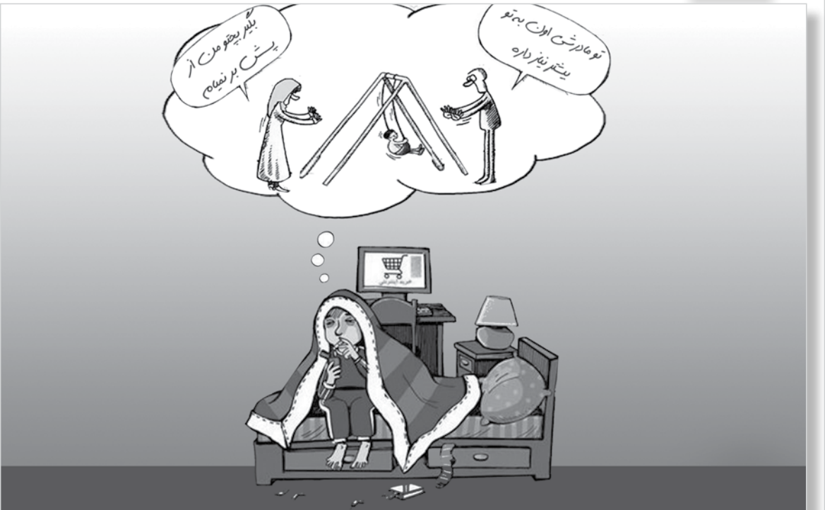
طرح : معصومه زارعی