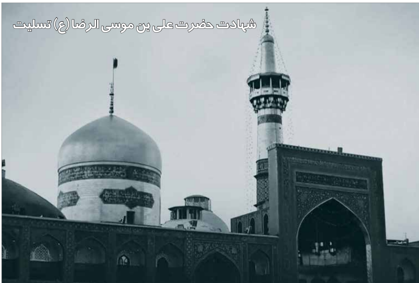
شهادت حضرت علی بن موسی الرضا (ع) تسلیت