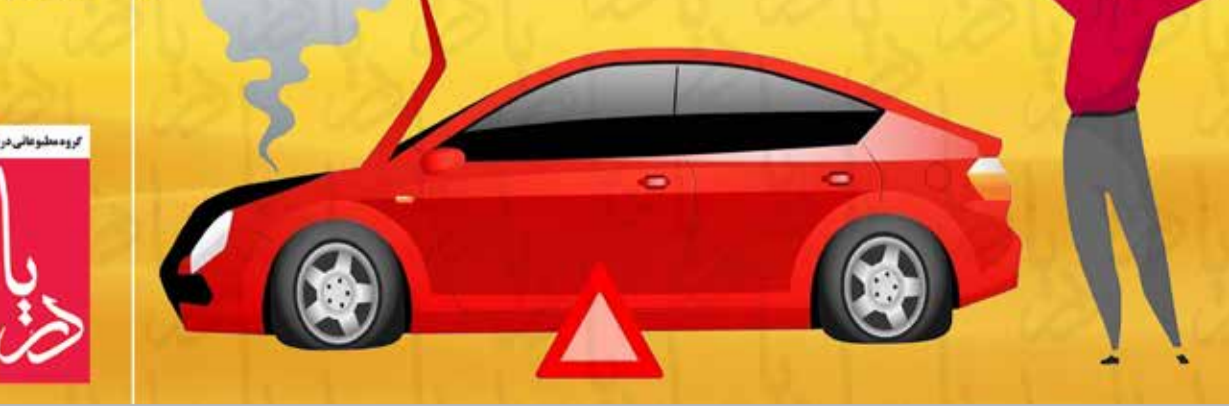
گروه اطلاعاتی دریا