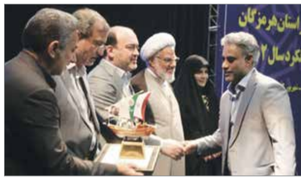
گروه خبر // سازمان صنعت، معدن و تجارت هرمزگان، دستگاه برتر بیست و هفتمین جشنواره شهید رجایی استان هرمزگان در ارزیابی عملکرد در شاخص های عمومی و اختصاصی گروه تولیدی شد.

بنابر این گزارش، به همین مناسبت سازمان صنعت، معدن و تجارت هرمزگان از استاندار هرمزگان لوح تقدیر و تندیس جشنواره را دریافت کرد.