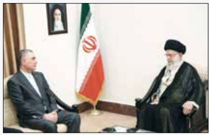
رهبر انقلاب در دیدار رهبر ملی ترکمنستان مطرح کردند