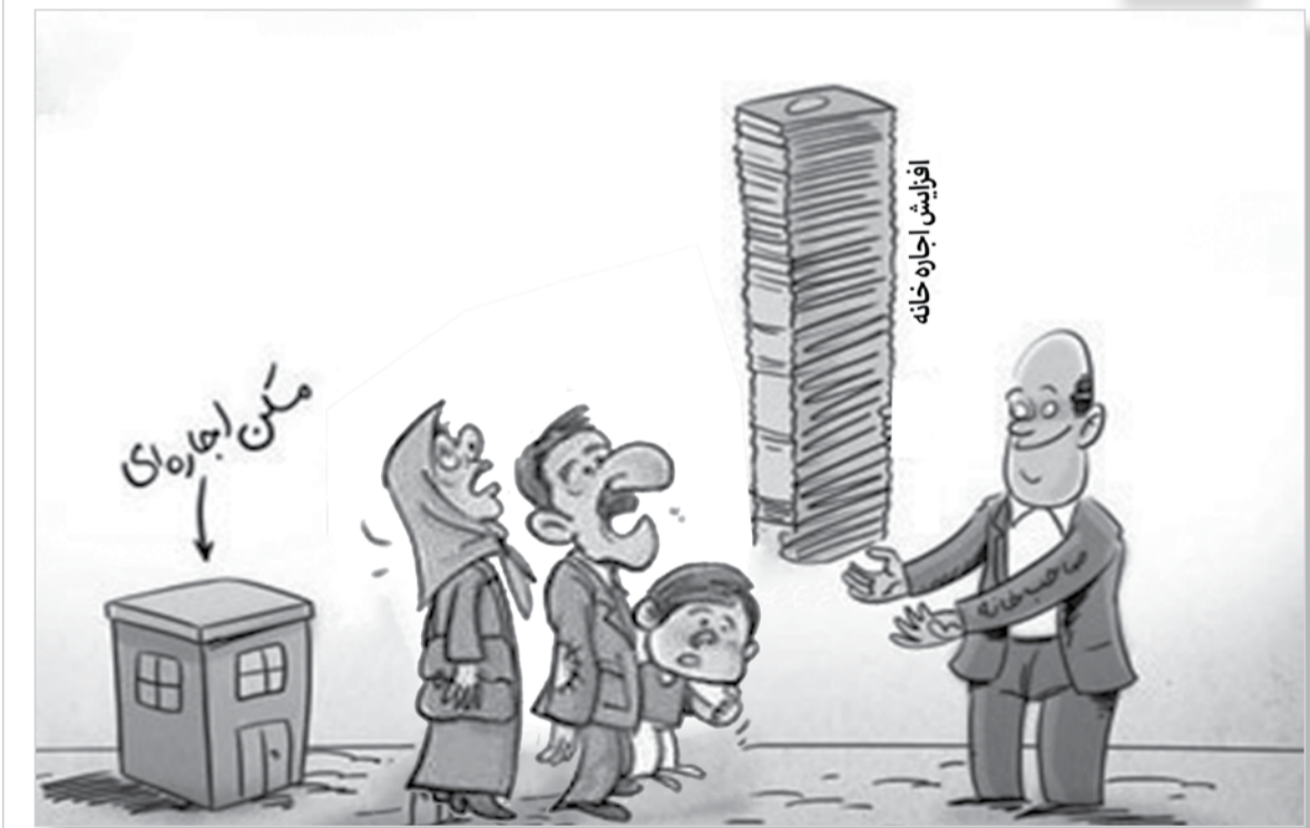
طرح: معصومه زارعی