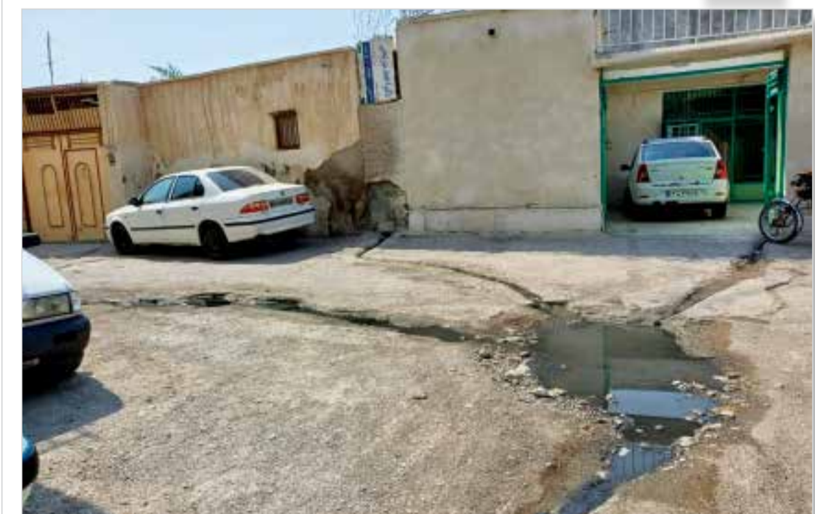
فاضلاب روان در کوچه های بندرعباس،حتی جلوی مطب پزشکان