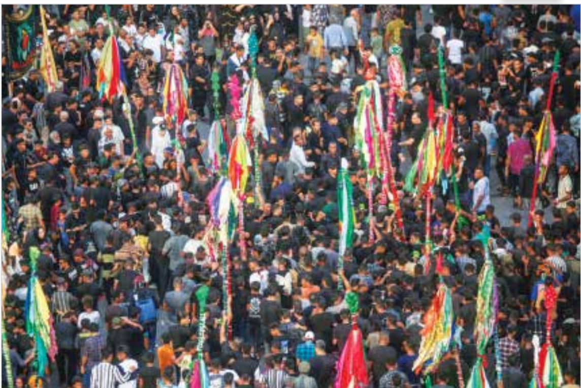
آیین سنتی علم گردانی در میناب