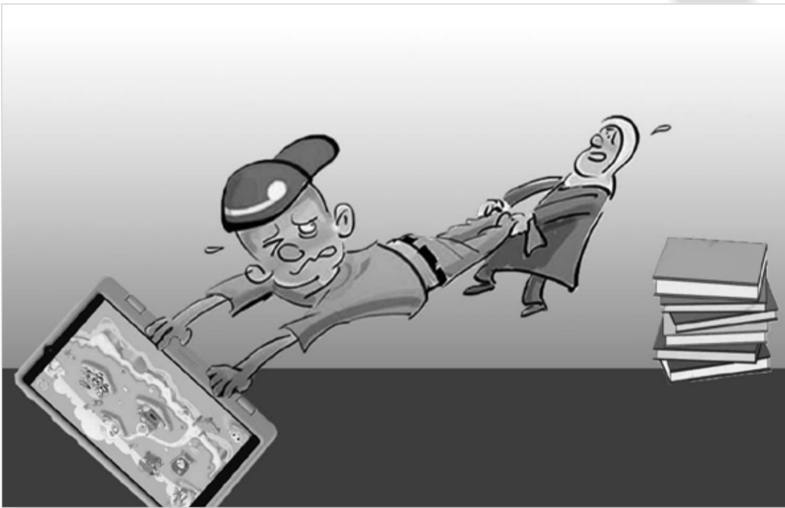
طرح: معصومه زارعی