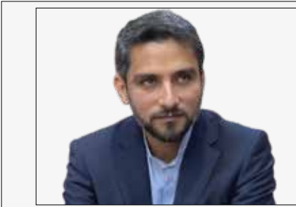
یعقوب دبیری نژاد

خبر اختصاصی // شهردار بندرعباس گفت: از مدیروان صنایع خواهش می کنم برای مردم شهر بندرعباس هم خیری داشته باشند و خدماتی از خودشان برای بنگاه ها بگذارند. به گزارش خبرنگار دریا، مهدی نوبانی در جمع خبرنگاران با بیان این مطلب افزود: صنایع می توانند در بازگشایی معابر، احداث پارک و... مشارکت کنند و آن پروژه را هم به نام خودشان نامگذاری می کنیم. نوبانی اظهار داشت: این صنایع حتی می توانند ماشین آلات شان را در اختیار شهرداری قرار دهند تا برای اجرای پروژه های عمرانی و... از آنها استفاده کنیم. وی خاطر نشان کرد: اگر صنایع همراه مدیریت شهری باشند، بخش زیادی از مشکلات شهر برطرف می شود و در عمران و آبادانی شهر تسریع می گردد. شهردار بندرعباس گفت: پرسنل صنایع هم در همین شهر زندگی می کنند و اگر اقداماتی را صنایع در بندرعباس انجام دهند، کارکنان خودشان نیز از این خدمات بهره مند می شوند. وی افزود: چرا بایستی سهم شهروندان از این صنایع فقط ترافیک، آلودگی و... باشد؟ صنایع بایستی در راستای ایفای نقش مسئولیت های اجتماعی شان، اقداماتی را برای شهر و مردم این شهر داشته باشند. نوبانی گفت: در حالی که گل گهر برای احداث یک پارک در سیرجان تاکنون ۸۵۰۰ میلیارد تومان هزینه کرده است و قرار است تا ۸۰ هزار میلیارد تومان هزینه کند و