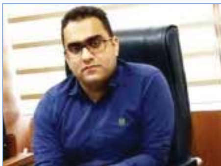
گروه شهرستان // رییس شورای شهر رویدر از وضعیت

آنتن دهی و اینترنت شهر وبخش رویدر انتقادکرد و گفت: قطعی مکررخطوط فاجعه بار شده است مسئولان امر چاره ای بیندیشید.