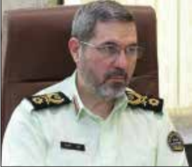
گروه حوادث // رئیس پلیس راهور فراجا از ابلاغ مبلغ جدید جریمه های رانندگی از سوی دولت

جریمه های رانندگی با مبلغ جدید اعمال می شود. وی خاطر نشان کرد: هر مصوبه هیات دولت که علاوه بر تکلیف برای دستگاه های دولتی برای مردم هم تکلیفی را ایجاد کند، حتما باید در روزنامه رسمی هم منتشر شده و بعد از ۱۵ روز قابلیت اجرا دارد. رئیس پلیس راهور فراجا افزود: سامانه اجرائیات پلیس هم