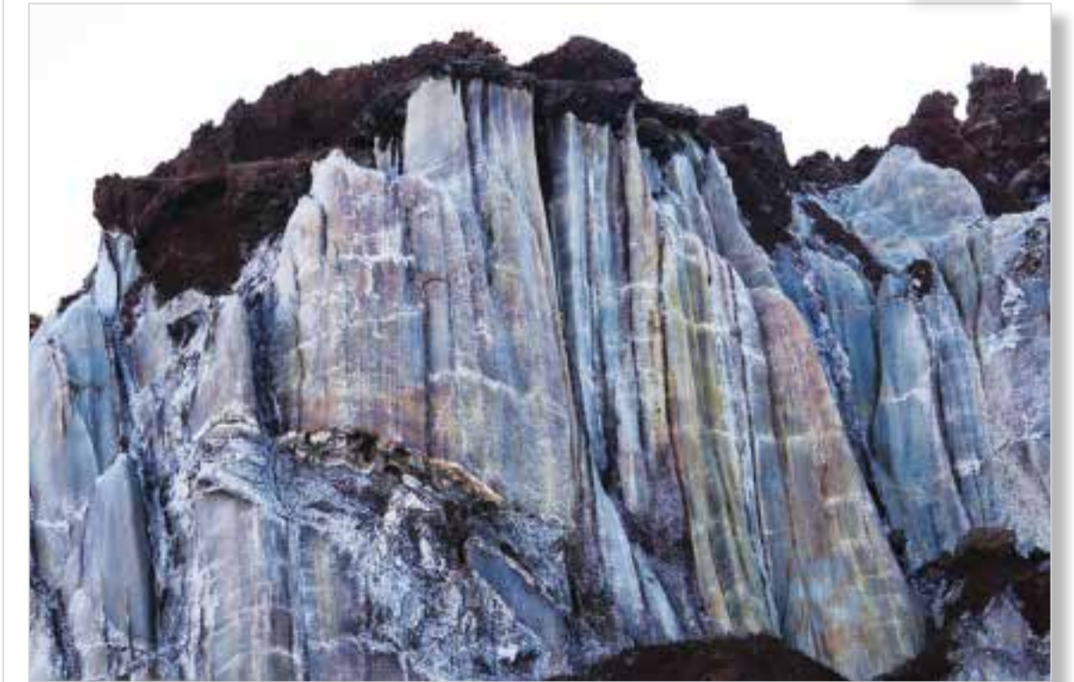
کوه نمک جزیره هرمز