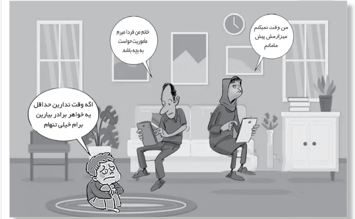
طرح : معصومه زارعی