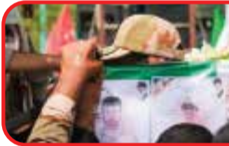
شهید مسعود پرکاس

سرهنگ شهید مسعود پرکاس شامگاه دوشنبه ۱۸ اردیبهشت ۱۴۰۲، در درگیری با باند اشترار مسلح در آب‌های نیلگون خلیج‌فارس بر اثر اصابت گلوله قاجاقچیان موادمخدر به شهادت رسید.